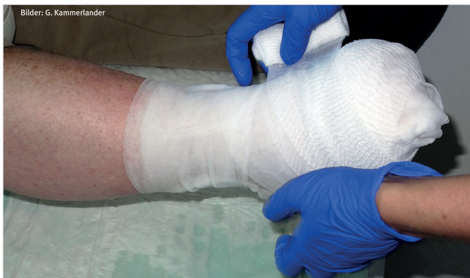
Nasser, zeitlich begrenzter Umschlag mit moderner Wundspüllösung

Kammerlander: Eine „Wundstandardisierung“ wird eine Institution an die optimalen Wunschparameter – Therapiekosten senken, Lebensqualität erhöhen und Arbeitszeit einsparen – heranzuführen. Ich selbst führe seit 1997 derartige „Wundstandardisierungsprojekte“ an klinischen und ambulanten Institutionen