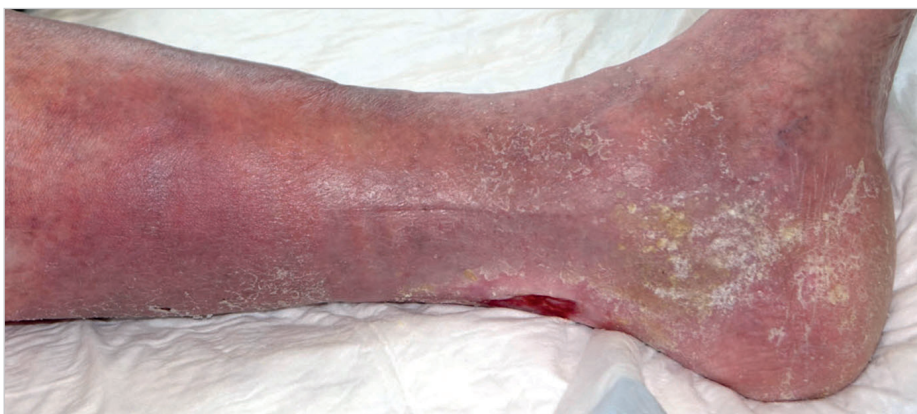
Hyperpigmentierung und chronisch sehr schwer heilende Wunde aufgrund einer chronisch venösen Insuffizienz (CVI)